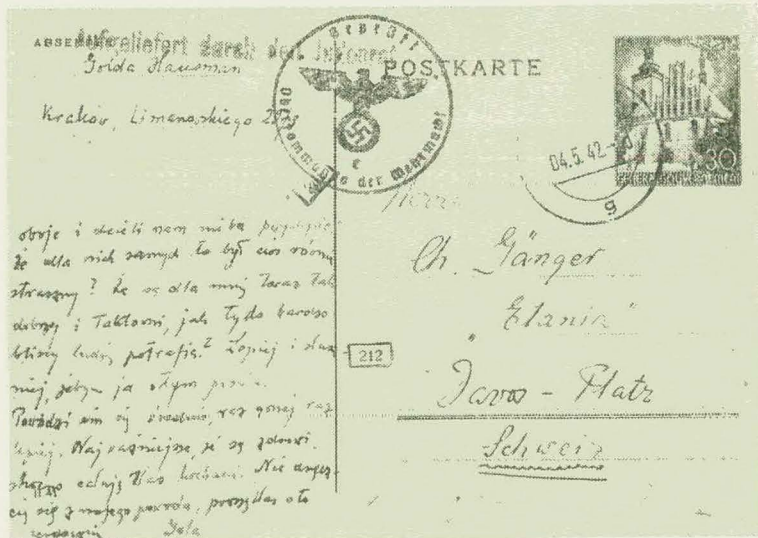
אגרתה של גולה מירא שנשלחה מקרקוב לארץ